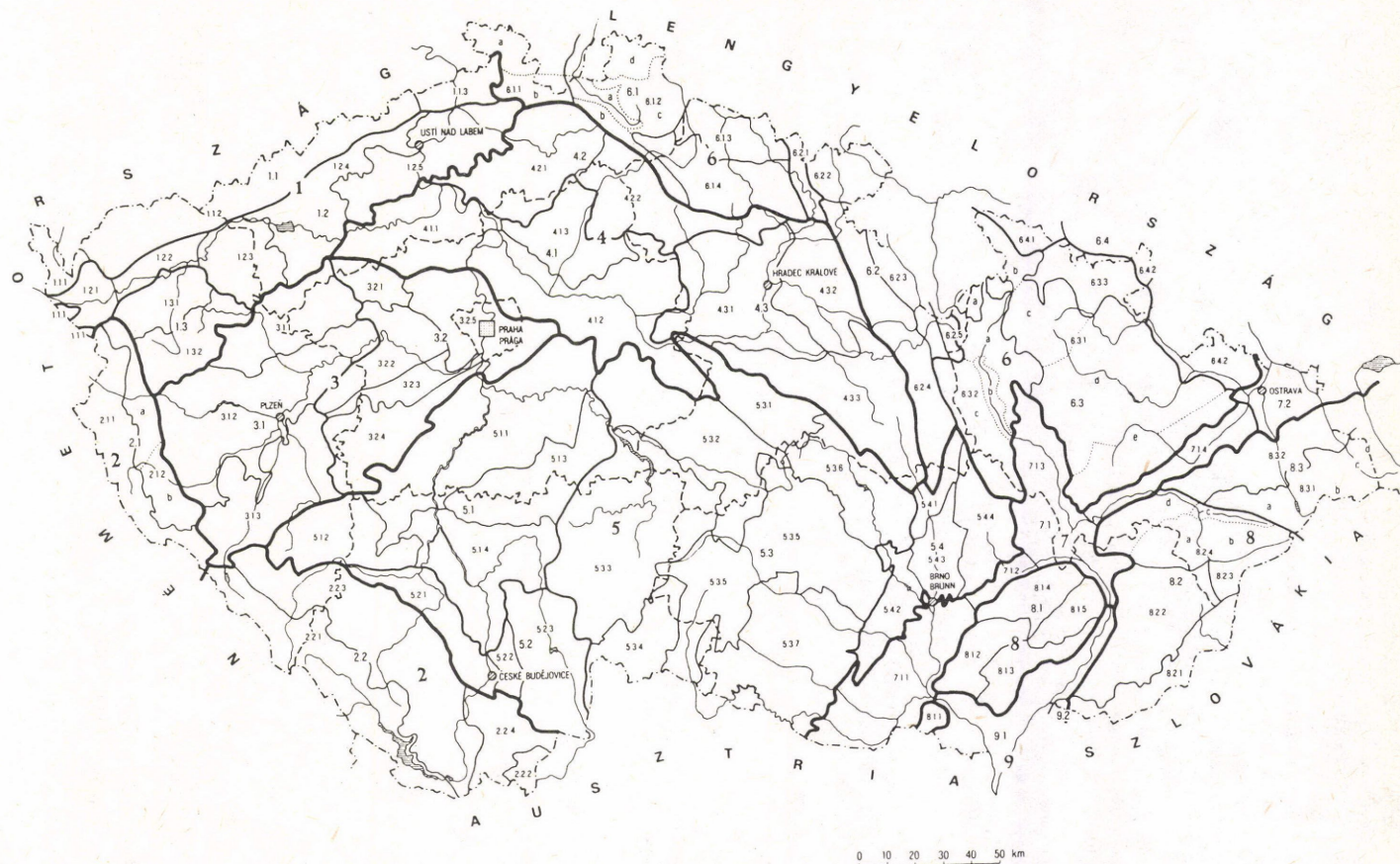
2. ábra. Cseh–Morvaország természeti tájbeosztása. – 1 = folyó, tó, víztároló; 2 = országhatár; 3 = kerülethatár; 4 = nagytájhatár; 5 = középtájhatár; 6 = kistájhatár; 7 = kistájrésztlet határa; 8 = főváros; 9 = kerületi székhely; 10 = nagytáj száma; 11 = középtáj száma; 12 = kistáj száma; 13 = kistájrésztlet betűjele