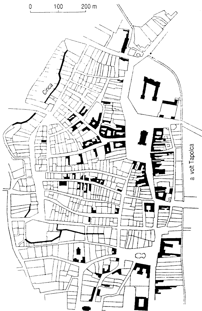
2. ábra. Pápa műemlékei Historical monuments of Pápa

iparfejlesztési politikának a területfejlesztés is alárendelődött, így Pápa a megye települései között az 1970-es évek végéig csak az 5–6. helyet foglalhatta el. A vázolt hátrány azonban némileg kedvező hatásokat is eredményezett, mert így a város el tudta kerülni a robbanásszerű változásokból fakadó visszasságokat. A konszolidált városfejlődés azonban városrészenként – a társadalmi és művi adottságokból fakadóan – sajátosan eltérő problémákat hozott létre, amelyek területrészenként differenciált településfejlesztési és -rendezési feladatokat körvonalaznak.