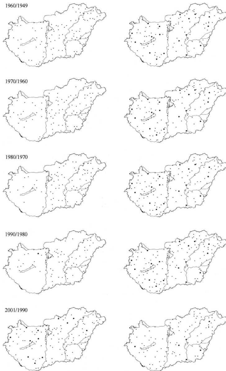
1. ábra. A városok népességének változása a megye teljes népességének változásához képest. Bal oldalon a B1 csoport városai, jobb oldalon az A1 csoportba tartozók. Mindkettő a feltüntetett időszakra vonatkozóan. (Bővebben lásd a szövegben)

Population change of urban settlements related to population change of the counties. Left side: cities of B1 group in the given period. Right side: cities of A1 group in the given period. (For more information see the text)