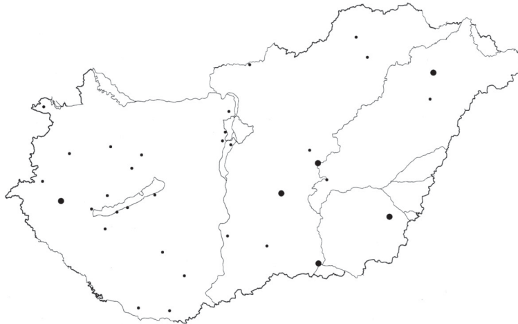
5. ábra. Városok, amelyek 1949 és 2001 között – a megye teljes népességével összevetve – mindig sikertelenek voltak

közül Makó, a kisebbek közül pedig Kunmadaras vagy Komádi. Hasonló mennyiségű, összesen 34 olyan városunk van, amely mindenkor a „sikeresek” közé tartott. Jellemző a területi megoszlásra, hogy ezek közül 10 alföldi, 17 dunántúli, 3 észak-magyarországi, 4 pedig a központi területhez sorolható (5. ábra).