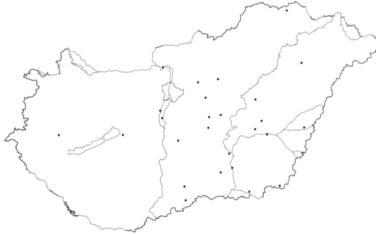
4. ábra. Városok, amelyek 1949 és 2001 között – a megye teljes népességével összevetve – mindig sikeresek voltak

Urban settlements always gaining population between 1949 and 2001 in comparison with the total population of the county