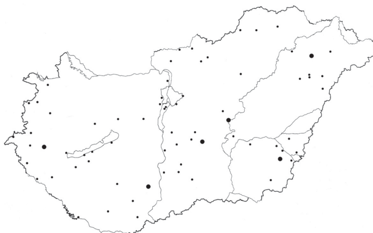
6. ábra. Városok, amelyek 1949 és 2001 között – a megye nem városi népességével összevetve – mindig sikeresek voltak

Urban settlements always gaining population between 1949 and 2001, in comparison with the rural population of the county