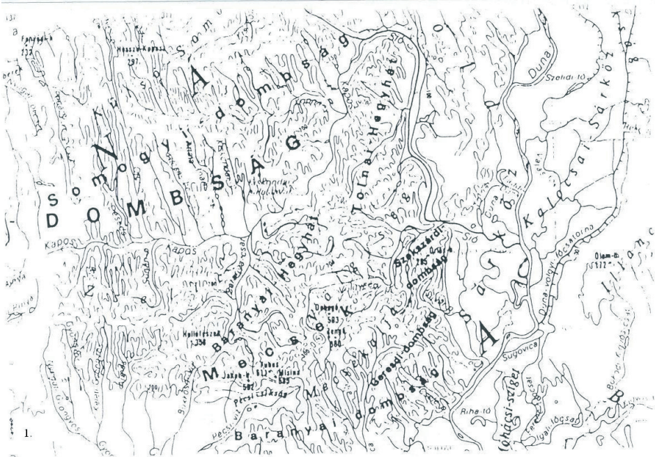
1. ábra. A Völgység Magyarország Nemzeti Atlasza domborzati és vízrajzi térképén Völgység: fragment of a sheet from the National Atlas of Hungary (relief and waters)

HOLUB J. a török kiűzése utáni Tolna megyei újjászerveződés kapcsán jegyzi meg tanulmányában, hogy bár a Völgységi járást csak 1725-ben szervezték meg, „neve valószínűleg még a középkorra nyúlik vissza, s azóta is használatban volt ennek a vidéknek a megjelölésére. Hogy általánosan ismert és használatban volt, mutatja, hogy a Baranyával folytatott határperben