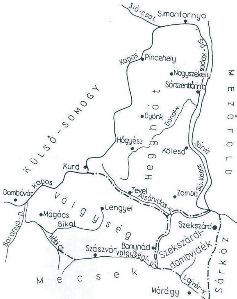
3. ábra. A Völgyes tájföldrajzi felosztása. (ÁDÁM L. 1969)

V. A Tolnai-dombság közös geomorfológiai vonásai ellenére az eltérő felszínalaktani jellemzőket hangsúlyozó kistáji tagolás, amely a szerkezeti törésvonalakon folyó vizeket tekinti határnak. Így azok: Kapos–Alsóhidaspatak–Völgyégi-patak–Hábi-csatorna–Baranya-patak alsó szakasza. Területe: 450 km 2 (ÁDÁM L.–MAROSI S.–SZILÁRD J. 1981; ÁDÁM L.–MAROSI S.–SZILÁRD L. 1990) (3. ábra). A szerzők elkülönítenek mind Baranyai, mind Tolnai Hegyhátat. ÁDÁM L. a területet két markáns részre bontja, az É-i és Ny-i kiemelkedett és